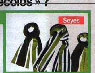
La marque Seyes s'est spécialisée dans les écharpes en coton « bio ».

■ Dans les salons « bio » comme Marjolaine, des marques comme Azimuts ou Ethosbio proposent des vêtements en chanvre, en coton « bio » ou en laine alpage. Avec une tendance ethnique très marquée. ■ Plus citadine, Jaël a des ailes fabrique des pantalons et des tailleurs que l'on peut porter au bureau.